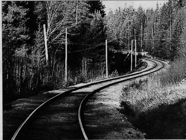
Järnvägen var framtiden och en anställning vid Statens järnvägar gav möjlighet till både utbildning och framflyttad position i samhället.